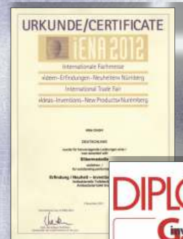
Silbermedaille von der Erfindermesse Nürnberg

ohne Borsten auf der Erfindermesse 2013 in Genf mit einer Goldmedaille belohnt wurde. Bereits bei der Premiere im Vorjahr wurde die innovative Toilettenbürste auf der internationalen Erfindermesse IENA Nürnberg mit der Silbermedaille ausgezeichnet. Und dies soll erst der Anfang gewesen sein. Was hat es mit der antibakteriellen Wirkung auf sich? Die Erklärung dafür liefern Silberionen, die je nach Modell dem Kunststoff- bzw. Silikonpad und dem Stiel der Bürste beigemischt werden. Getestet und zertifiziert wurde dies durch das internationale Forschungs- und Dienstleistungszentrum Institut Hohenstein.