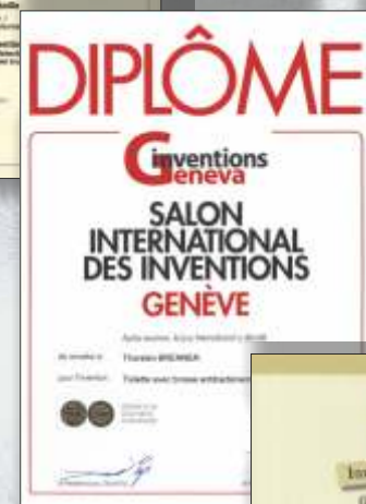
Goldmedaille von der Erfindermesse Genf