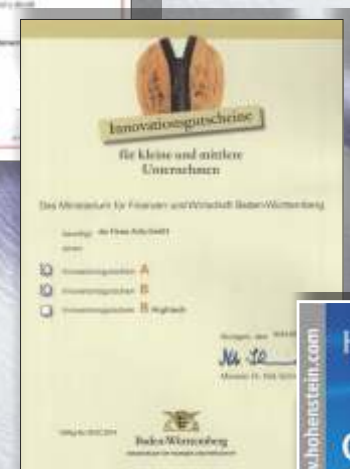
Innovationspreis vom Land Baden-Württemberg