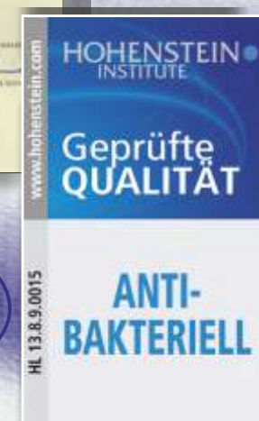
Bestätigung der antibakteriellen Funktion